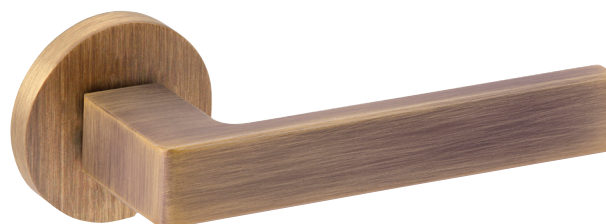
CODE : 119 981