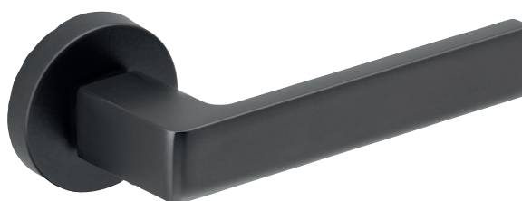
CODE : 119 975